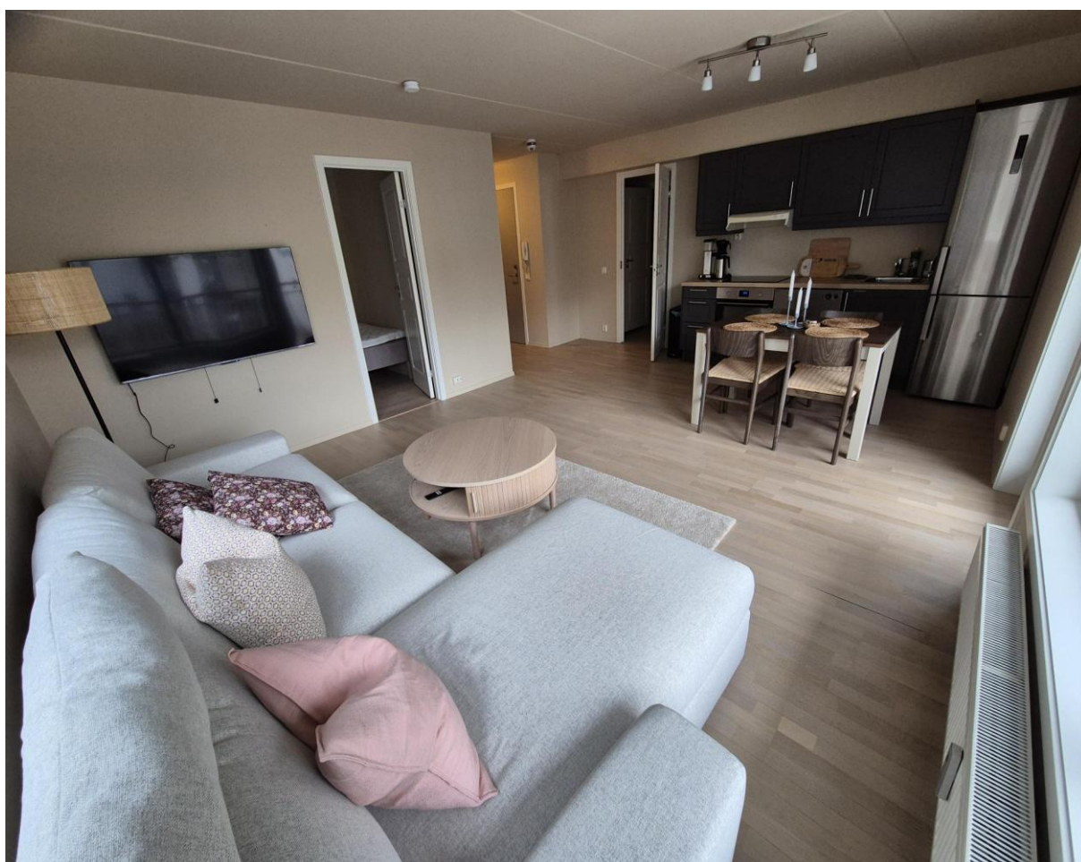
Stue sett fra vindusiden

For å komme seg inn hoveddøren til leilighetskomplekset må man bruke den GULE nøkkelbrikken som er på nøkkelknippet man har fått utlevert. Deretter er det bare å ta heisen/trappen til tredje etasje (man går inn i første etasje), gå inn i fellesgangen for leilighetene i etasjen og leiligheten til Norsk Tollerforbund ligger til venstre, i enden av gangen. Det står et stort messingskilt på døren med Norsk Tollerforbund.