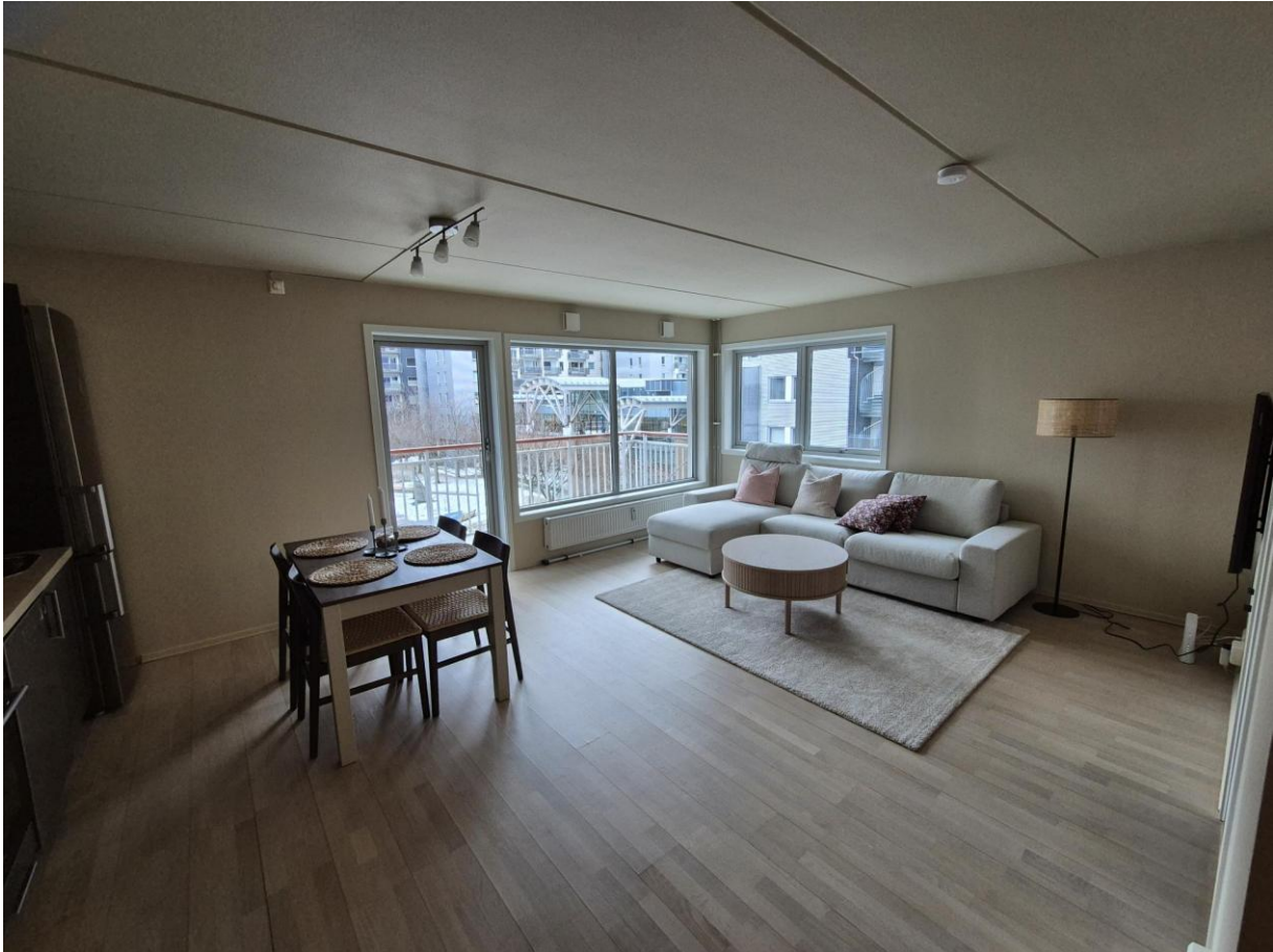
Stue sett fra gangen

Leiligheten består av åpen stue/kjøkken løsning, bad og to soverom. Soverom 1 inneholder en dobbeltseng (180cm x 200cm), mens soverom 2 inneholder en enkeltseng (120cm x 200cm). I tillegg er det mulighet til å slå ut en seng på sofaen i stua (150x200). Dette gjør at det totalt er sengeplass til fem personer. Det er fem dyner og fem puter i leiligheten, og sengetøy er tilgjengelig til alle disse. Kjøkkenet er godt utstyrt med oppvaskmaskin, platetopp, stekeovn, kjøleskap og kaffetrakter. På badet er det hjørnedusj med innfellbare dører, i tillegg til vaskemaskin og tørketrommel. Håndklær finnes i skapet i soverom 1. Det er også TV og internett i leiligheten.